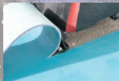
Pavimentos flexibles, moquetas y PVC