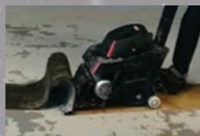
Pavimentos de resina